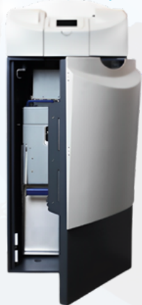
CM18 Le recycleur automatique pour le traitement de vos billets.